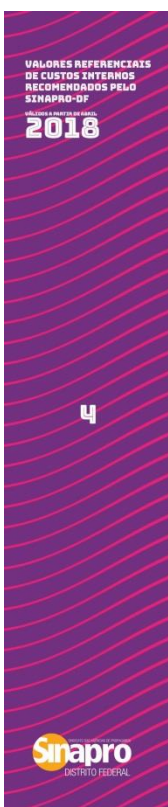
TABELA DE CUSTOS REFERENCIAIS